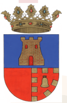
AJUNTAMENT DE GAIANES