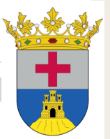
AJUNTAMENT DE L'ORXA