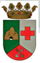
AJUNTAMENT DE BENIARRÉS