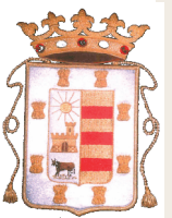
AJUNTAMENT DE VILALLONGA