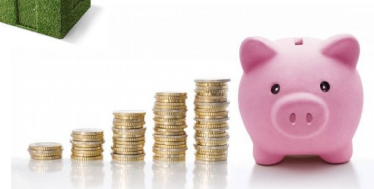
AHORRO FACTURAS REVALORIZACIÓN VIVIENDA MAYOR VIDA ÚTIL EDIFICIO