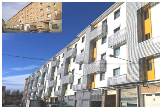
MEJORA IMAGEN URBANA REGENERACIÓN DEL BARRIO