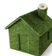
MEJORA MEDIO AMBIENTE