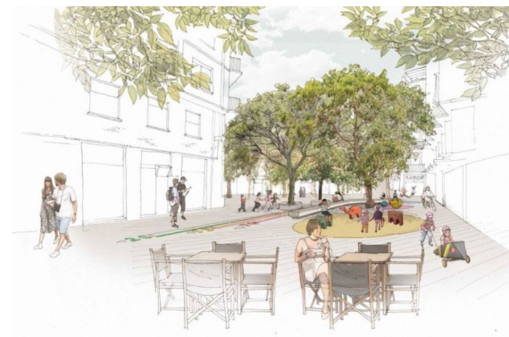
MEJORA DE URBANIZACIÓN Y EL ENTORNO URBANO