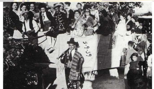
5 de Septiembre de 1939

Entrada para socias y socios de la comparsa de ANDALUCES y acompañante, presentando el carnet. Y a los compromisarios y acompañantes que hayan realizado la visita turística guiada, presentando la documentación recibida en la recepción al inicio de la jornada.