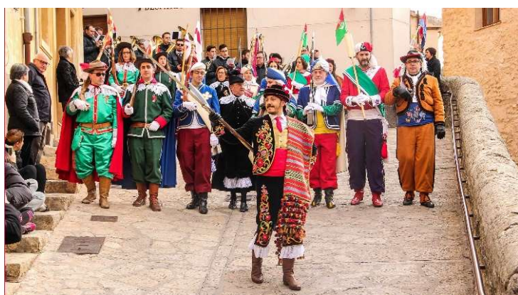
Fiestas de BOCAIRENT

Menos mal que no le hicieron caso, porque eso hubiera supuesto la eliminación de todas o de casi todas las comparsas del bando cristiano de los pueblos con fiestas más antiguas y tradicionales. Así, por ejemplo, si se le hubiera hecho caso, habría desaparecido el bando cristiano completo en dos poblaciones con unas fiestas tan antiguas y tradicionales como Petrer y Bocairent, por ejemplo, que se celebran desde 1821 y 1860, respectivamente. En ellas, todas las comparsas del bando cristiano, la mayoría de ellas centenarias, serían anacrónicas para el autor de esa propuesta (Vizcaínos, Tercios de Flandes, Marineros, Estudiantes y Labradores, en Petrer; Españolitos, Granaderos, Contrabandistas, Zuavos y Estudiantes, en Bocairent). En Elda, sólo se habría salvado la comparsa de Cristianos, ya que las demás (Piratas, Contrabandistas, Estudiantes y Zíngaros) habrían tenido que desaparecer. En Villena, sólo se habrían salvado las comparsas de Cristianos, Almogávares y Ballesteros. Estas dos últimas son, precisamente, las más modernas (1954 y 1966, respectivamente) y las más pequeñas del bando cristiano, y sustituyeron a otras dos tan anacrónicas, pero tan antiguas, como los Romanos (que ya existía en 1857) y los Americanos (1928). Habrían tenido que desaparecer, en cambio, las comparsas de Piratas, Estudiantes, Marineros Corsarios, Andaluces y Labradores, que son precisamente las más grandes y las que más simpatías tienen en la población.