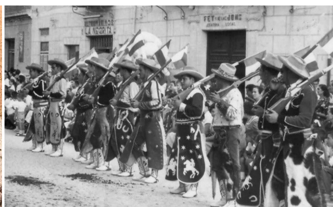
Comparsa de AMERICANOS (Villena)