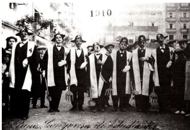
COMPARSA ESTUDIANTES NUEVOS DE ALCOY Fundada en 1882 - Desaparecida en 1915

Pero la eliminación de los anacronismos no se limitaría a las comparsas, sino que afectaría a otros elementos festeros, algunos de ellos tan importantes como los arcabuces o los mismos cargos festeros (capitán, alférez, sargento y cabo), que tienen su origen en la soldadesca y ésta, a su vez, en las Milicias del Reino, que fueron creadas en 1609. No digamos las rodelas, pajes, volantes, rueda de banderas, movimientos militares como El Rogle de Beneixama o el Paso de Revista de Bocairant, y la mayoría de los textos de embajadas, sobre todo los más antiguos. El mismo Salvador Doménech escribió los textos de embajadas de varias poblaciones (Elche, Crevillent, El Tractat d'Almizrra) poniendo especial empeño en el rigor histórico.