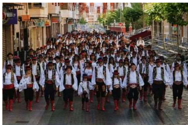
Comparsa de ZINGAROS de Elda