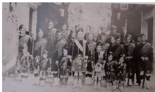
Foto datada en 1892, Comparsa de Escoceses de IBI