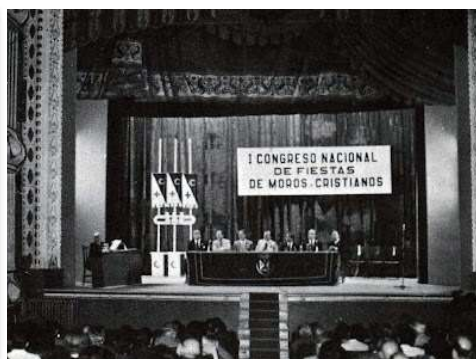
I Congreso Nacional de Fiestas de Moros y Cristianos 1974. Origen de la UNDEF.