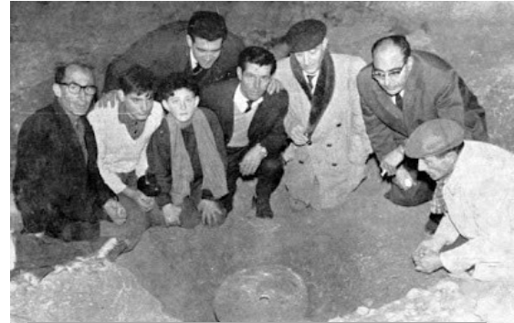
1963 HALLAZGO DEL TESORO DE VILLENA