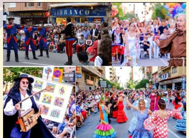
Acto del Contrabando de Villena